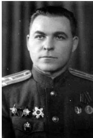
Г.С. Горелкин - первый начальник УНКВД по Курганской области.

Первым начальником, возглавившим УНКВД Курганской области, был опытный чекист - Горелкин Гавриил Семенович, прибывший с должности начальника УНКВД Пензенской области.