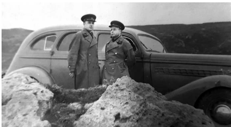
Город Махачкала. Лето 1943 года.